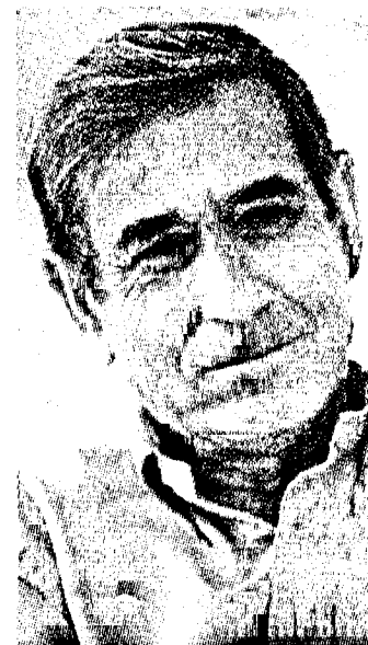
בן עמי. קמפ דיוויד אינו העיקר

הה באמת קרה בקמפ דיוויד? איך נפח תהליך השלום את נשמתו? שלמה בן עמי, אז שר החוץ, ניהל יומן מפורט של הוועידה ובפעם הראשונה הוא פותח את הקופסה השחורה המתעדת את ההתרסקות הקטלנית שהחלה בשטוקהולם, החשיכה במרילנד, הושלמה בטאבה, ומהדהדת מדי יום בערי ישראל